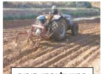
חריש ולאחריו תיחוח