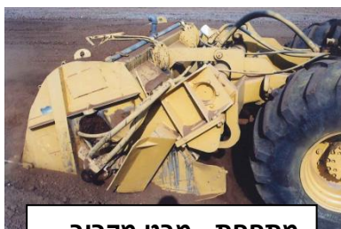
מתחת - מבט מקרוב