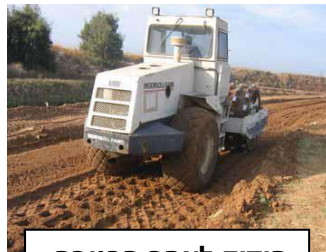
הידוק לאחר הרטבה