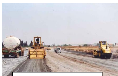
תיחוח ערבוב והרטבה