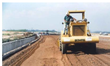
תיחוח ולאחריו הרטבה והידוק